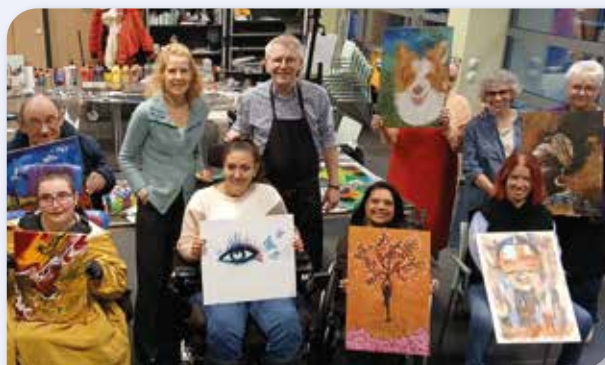
Georges Gilkinet en visite à Altéo Liège lors d'un atelier ce 14/11.

Les mouvements de la MC, c'est son supplément d'âme. Et parmi ceux-ci, Altéo a (au moins) un double rôle. D'une part, mettre en œuvre des activités au bénéfice des personnes dont l'état de santé ou de handicap limite l'autonomie. D'autre part, à travers une dynamique de mouvement social, identifier et mener les actions et initiatives à prendre pour faire en sorte que