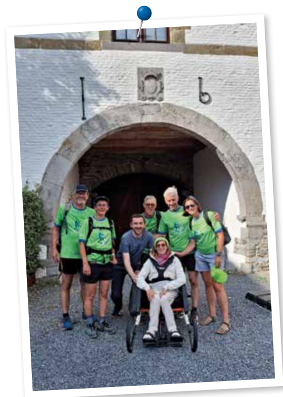
Sourires et souvenirs gravés.