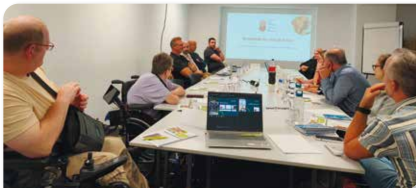
Tous les acteurs autour de la table pour des échanges riches !

Le jeudi 11 septembre, le groupe Accessibilité de Mons a continué sa série de rencontres politiques avec les élus de Mons-Borinage. Nous avons donc eu la chance de recevoir :