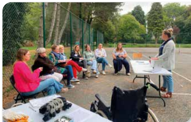
Échanges en plein air autour de l'inclusion.

Dans le courant du mois de septembre, Altéo, en partenariat avec Ocarina, a répondu à l'invitation de la Mutualité chrétienne pour animer un stand