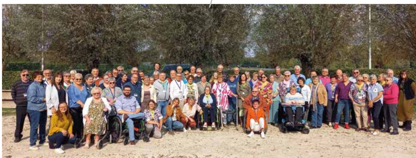
Merci à toutes les personnes présentes et surtout... pour votre engagement !