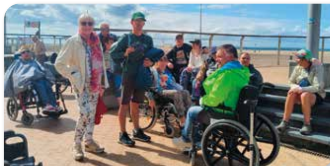
Heureusement que la météo s'est assagie en après-midi. Le groupe a pu sécher !

Au restaurant commence alors un ballet de chaises et de fauteuils roulants pour que tout le monde se trouve une place confortable. Tous sont accueillis chaleureusement et le service est très méthodique. L'entrée, le plat et le dessert sont copieux, l'ambiance aux tables chaleureuse. Bref un très chouette moment.