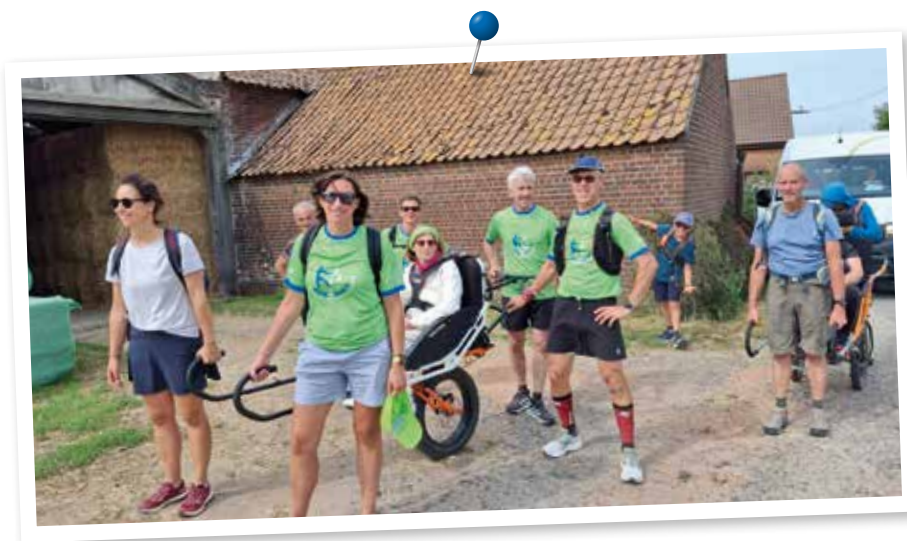
Joie et partage en pleine nature.