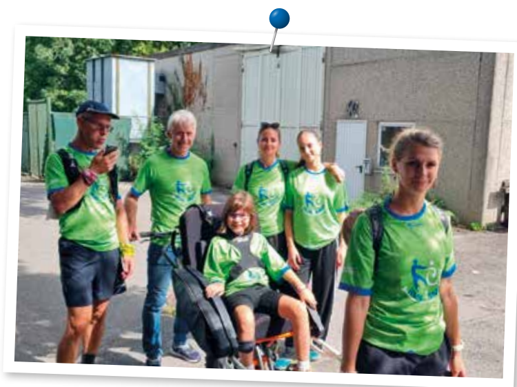
Un pas après l'autre, ensemble.