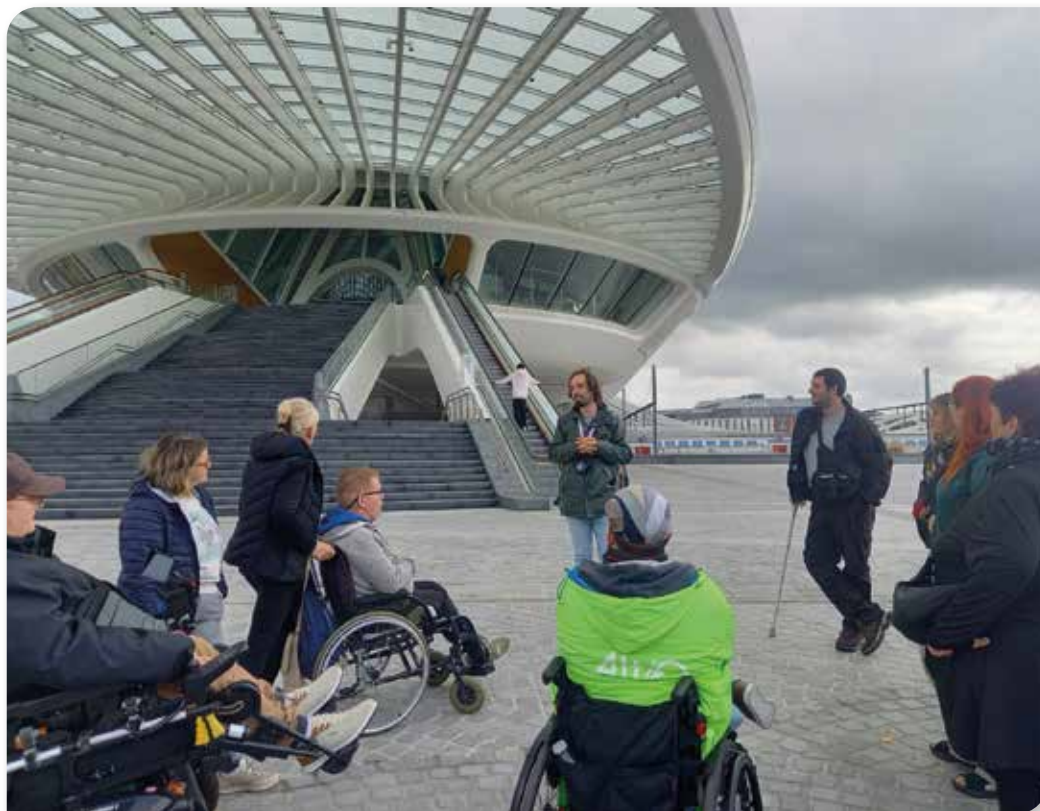
Le groupe étudie l'accessibilité de la gare de Mons avec Passe Muraille

Né des réflexions des membres et des volontaires de la région de Mons autour des questions de mobilité et d'accessibilité, qu'elle soit physique ou humaine, le groupe Accessibilité de Mons poursuit ses ambitions en 2026. Ces enjeux constituent un facteur important d'isolement social pour l'ensemble de nos membres Altéo. Notre groupe réfléchit à des projets autour de ces thématiques, ce qui nous a permis de réaliser de belles actions et de positionner Altéo comme un acteur local majeur.