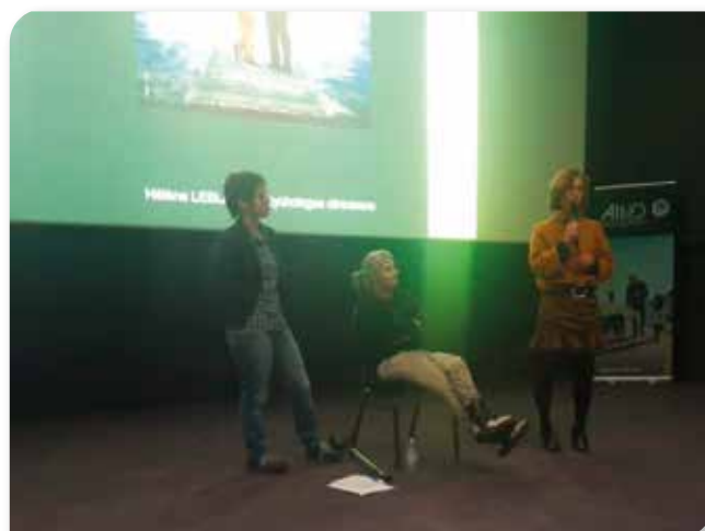
Encore merci au Réseau 107 pour cette collaboration

La soirée s'est poursuivie par une conférence-débat animée en partenariat avec le Réseau Partenaires 107. Les échanges ont permis d'aborder les défis quotidiens liés à l'inclusion, mais aussi les ressources, les forces et les réalités vécues par les personnes en situation de handicap.