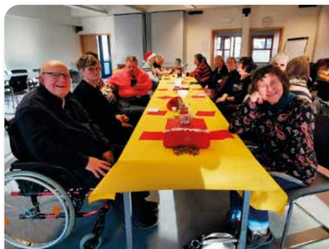
Un évènement qui réunit chaque année

Le rendez-vous est déjà fixé pour l'année prochaine... Et n'hésitez pas à venir nous rejoindre !