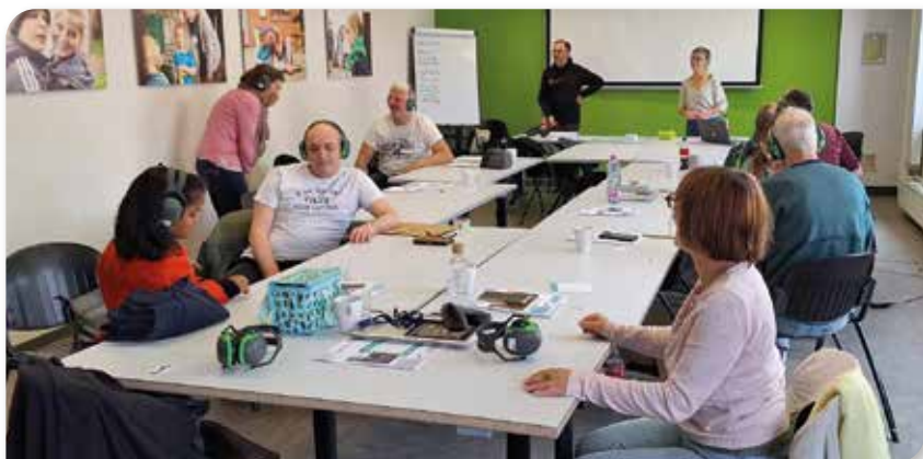
Quand il y a du monde, l'ambiance est toujours meilleure