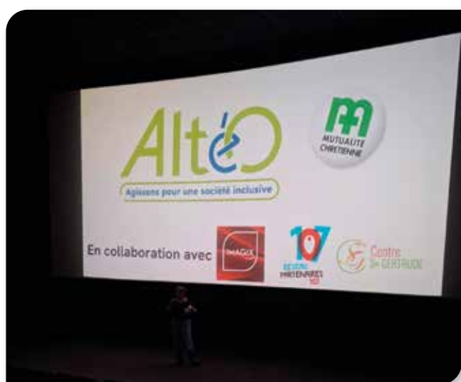
Chut ! Ca va bientôt commencer.

Le 3 décembre, à l'occasion de la Journée internationale des personnes handicapées, Altéo Hainaut-Picardie a réuni une soixantaine de participants à Imagix Tournai pour une soirée alliant culture, réflexion et convivialité.