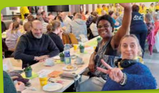
Goûter St Joseph 2025

Au programme, jeux anciens en bois, animation musicale et dégustation de pâtisseries, tombola... Le bar sera également ouvert avec boissons chaudes, bières locales et softs, le tout à petit prix. Cette date est aussi la journée internationale de la trisomie alors,