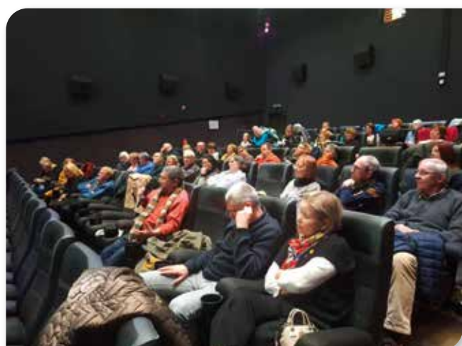
Un public attentif...

La projection du film « Presque », réalisé par Bernard Campan et Alexandre Jollien, a ouvert l'événement. À travers un récit sensible et profondément humain, le film invite à changer notre regard sur le handicap, à dépasser les préjugés et à accueillir la rencontre avec l'autre dans toute sa simplicité.