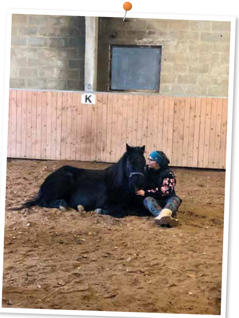
Moment de connexion avec la jument Tequila

Le cheval, partenaire silencieux mais d'une justesse incroyable, m'a ramenée à l'essentiel : ressentir, ralentir, accueillir. Lui, il ne triche pas : il répond à ce que l'on émet vraiment, pas à ce que l'on croit montrer !